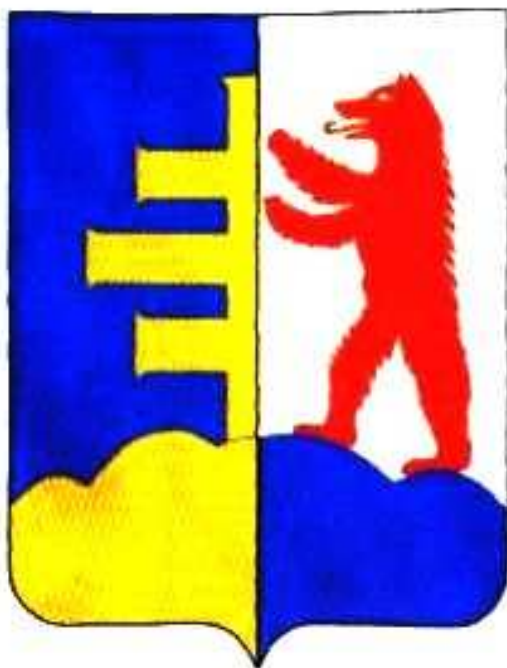
Návrh strany Gagatko-Zurkanovičeva

Konečně dne 17. března 1920 zaslal šéf Civilní správy Podkarpatské Rusi Presidiu ministerstva vnitra v Praze připomínky k navrženému znaku Podkarpatské Rusi a návrhy na jeho podobu: „K číslu 14530 podávám zprávu, že strana Gagatko-Zurkanovičeva nečiní k navrženému znaku Podkarpatské Rusi podstatných námitek, jen by si přála, aby štít na zdél rozdělený v dolní části vykazoval tři pahorky, také rozdělené a sice pravá polovice zlatá, levá modrá. V pravé polovici štítu aby místo tří zlatých břevnen byla polovice řeckokatolického kříže, jehož horní a dolní rameno jest stejně dlouhé a prostřední delší. V levé polovině stříbrné by na modrém podkladu poloviny pahorků stál červený medvěd ve skoku.“