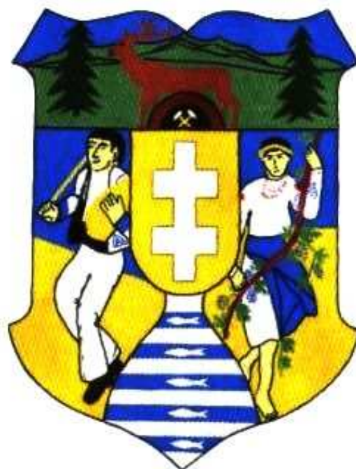
Návrh strany dr. Vološina