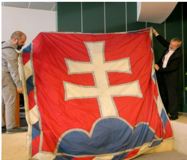
Originál standarty prezidenta Slovenské republiky.