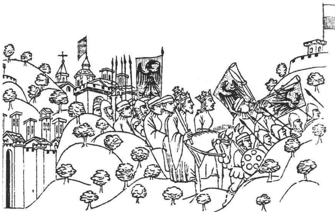
Císař Karel IV. a císařovna Anna na cestě z Luccy, květen 1355, kresba podle iluminace v kronice Giovanniho Sercambiho (1348-1424)

O dvaadvacet let později, 6. února 1355 navštívila Luccu Karlova manželka Anna a o několik dní později, již spolu s manželem, navštívila hrad Montecarlo. Návštěva hradu při hranicích Florentské republiky nebyla zřejmě jen vzpomínkou na léta mladosti, ale byla také varováním Florentinům, kteří otáleli s poskytnutím podpory. Poté pokračovali do Říma, kde